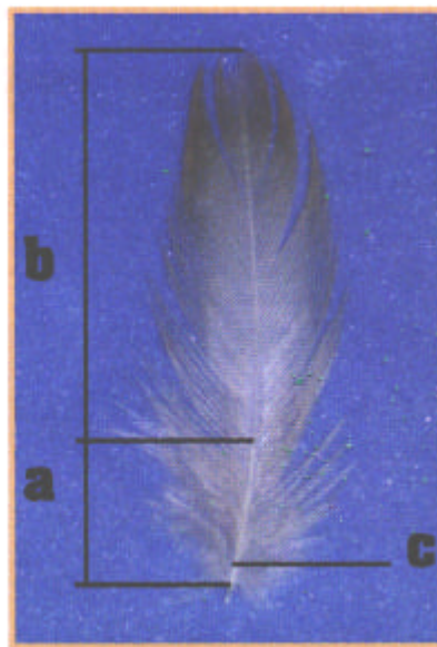
Abb. 1 a ist der Dunenteil der Feder b ist die Federfahne c ist der Federkiel

Während im Dunenteil der Feder die Bogenstrahlen und Hakenstrahlen ungeordnet erscheinen, sind sie im Bereich der Federfahne regelmäßiger angeordnet. Im mittleren Bereich der Federfahne überlappen die Bogen- und Hakenstrahlen, im oberen Bereich der Federfahne kann die Überlappung verloren gehen.